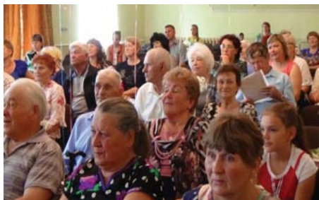
Чествование юбилейных пар

содержания больных ветеранов и инвалидов в доме-интернате пос. Шеберта, отделениях сестринского ухода больниц поселков Шумский, Атагай, с. Худоеланское. Ветеранские организации в данных муниципальных образованиях берут шефство над проживающими в хосписах: устраивают концерты, поздравляют с праздниками, организуют акции благотворительной помощи, привлекают тимуровские команды и волонтеров, обеспечивают газетами, книгами. В рамках программы «Патриотическое воспитание молодежи» Советом ветеранов проводятся мероприятия, ставшие традиционными, на которые собираются сотни ветеранов и пенсионеров: в честь Дня Победы, чествование юбилейных пар, зимняя и летняя спартакиады, туристический слет, ветеранские субботники, новогодний «Голубой огонек» и другие.