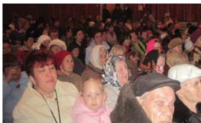
Встречи с избирателями