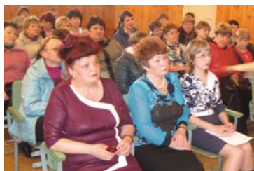
Рассмотрение вопроса «О реализации программы социально-экономического развития Новожилкинского муниципального образования»

В течение 2014 года проводилась работа по привлечению дополнительных средств, необходимых для выполнения мероприятий Программы, в том числе реализации перечня проектов «Народные инициативы». Так, выделена субсидия в размере 798 700,0 руб. при софинансировании из местного бюджета в размере 8 068,00 руб. На сданные средства проведен ряд мероприятий: