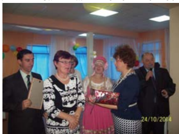
Победители конкурса «Лучшая усадьба»

ходящихся в трудной жизненной ситуации: «От чистого сердца», «Помоги собрать ребенка в школу», «Школьный портфель», «Подари улыбку детям». В течение ряда лет Советы женщин являются организаторами традиционных районных конкурсов, таких как «Почетная семья», «Лучшая усадьба», «Лучшая хозяйка». Во всех областных конкурсах: «Женщина, меняющая мир», «Духовные скрепы сибирского села», «Семейный альбом», «Старая пластинка», «Сельская семья – опора духовности нации», которые проводились на региональном уровне, участники от Нижнеудинского района становились победителями и занимали почетные места.