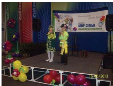
Конкурс «Семейный альбом»

Значимую деятельность на территории г. Нижнеудинска и Нижнеудинского района осуществляет Общественная Организация Инвалидов «Доверие» (далее – ООИ «Доверие»), которая реализует ряд крупных социальных проектов, в том числе: