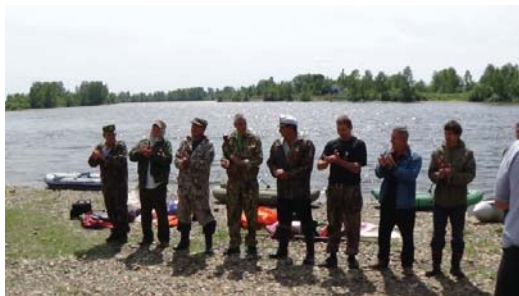
Участники сплава по р. Уда

В июне 2014 года организацией «Патриот» проведена областная акция «Регата памяти – 2014» (сплав по р. Уда), посвященная 25-летию вывода советских войск из Афганистана.