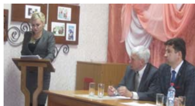
Семинар-совещание по реализации перечня проектов «Народные инициативы»