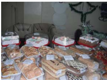
Победитель конкурса «Лучшее предприятие торговли Новожилкинского муниципального образования – 2014»