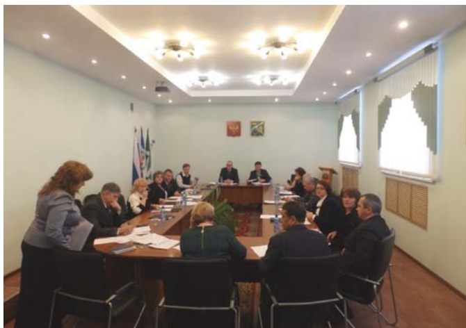
Совместное заседание депутатов районной Думы и Думы г. Усть-Кута в рамках круглого стола

Также такая форма межмуниципального сотрудничества, как совместные заседания районной Думы и Думы г. Усть-Кута в рамках круглого стола, способствует повышению правотворческого процесса и выработке совместных предложений для дальнейшей работы.