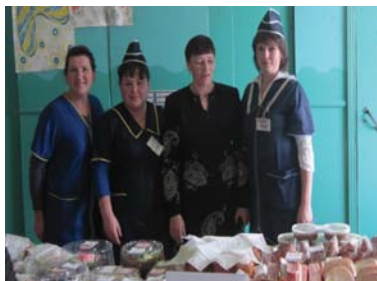
Победитель конкурса «Лучший предприниматель Новожилкинского муниципального образования – 2014»