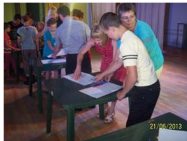
Конкурс «Почетная семья»